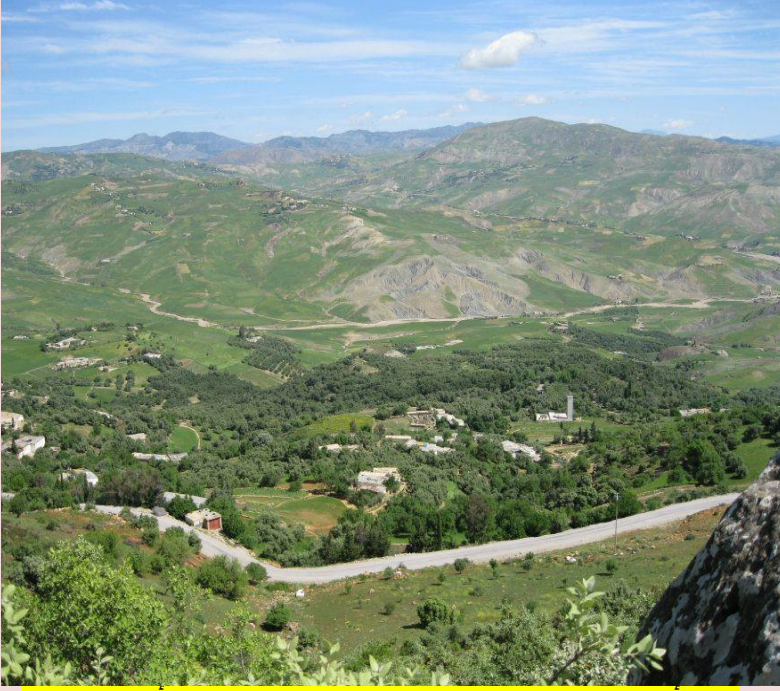
فرقة أولاد جرو التي تحد مع فرقة الترابية بالوادي في أسفل الجبل

فالحرب بين الفرق/الفخدات وحتى ولو لم تدمر الجميع فإنها قد تستغل من طرف شخصيات طموحة للزعامة تتحول مع مرور الوقت إلى شخصيات قوية مستبدة تقضي على جميع المؤسسات وتستبعد الجميع بما فيهم ساكنة الفرقة القبلية التي ينتمي إليها الزعيم. لا يزال الكبار في السن بقبيلة بني فصوص يتداولون روايات تخص حالات النزاع بين فرقتي الترابية وأولاد جرو والتي استمرت بشكل ضعيف إلى ما بعد استقلال المغرب لكن وبالإضافة إلى الآليات المذكورة كان الكثير من الذين يتدخلون عبر التحكيم والوساطة يقترحون توظيف آلية الزواج ما بين