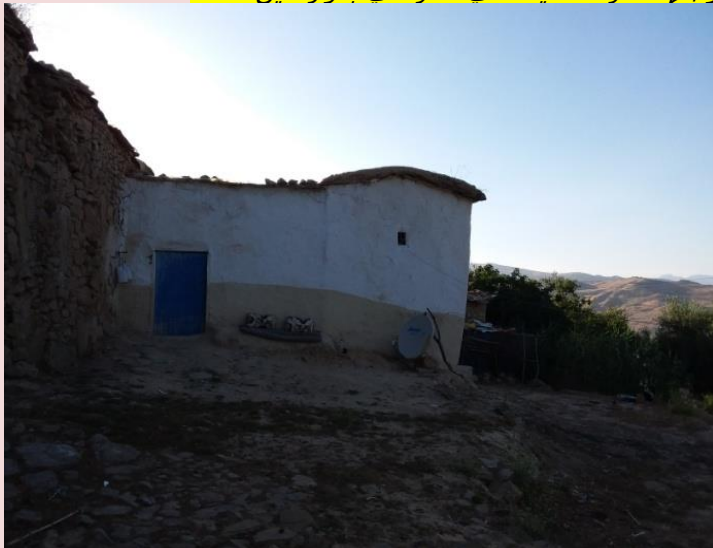
واجهة منزل القايد علي المراهي بدوار عين الثلاثاء