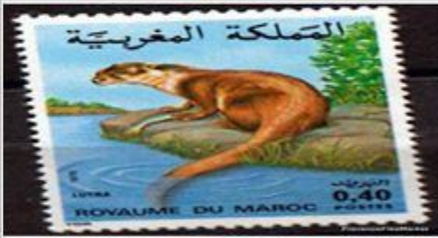
كلب الماء الذي كان مستوطن واد بني خلد حتى بداية القرن الماضي

تدهور التنوع البيولوجي: كان هذا التنوع متميزا بغناه في الماضي، إذ تزرخ حكايات الأجداد بأصناف عديدة من الحيوانات والحشرات، إما انقرضت نهائيا أو هي في طريق الانقراض، كما يتحدث الناس الآن بحسرة عن تقلص عدد بعض أنواع الأشجار. إن تدهور الموئل أو الموطن الطبيعي habitat naturel لهذه الثروة الطبيعية، والقنص الجائر بكل أنواعه من «نصبة» و «خشبة» و «فخة» و «فردى بوحبة» هما السببان الرئيسيان لهذا الوضع المتدهور. وهناك لائحة طويلة لبعض الأنواع التي انقرضت أو في طريق الانقراض من البرانس، رغم أنها مستوطنة أي لا تعيش إلا في المغرب أو شمال إفريقيا. (endémique)