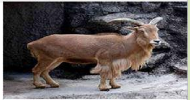
الأروية (أروي أو التيس) والتي شوهد آخر قطعائها بالناخصة