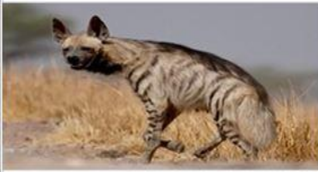
تم القضاء على الضباع المخططة التي كانت تستوطن شمال أفريقيا