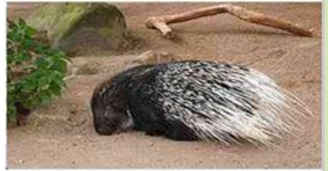
انقرض الضربان من أرضنا بسبب جشع أجدادنا ولعمهم بلحمه