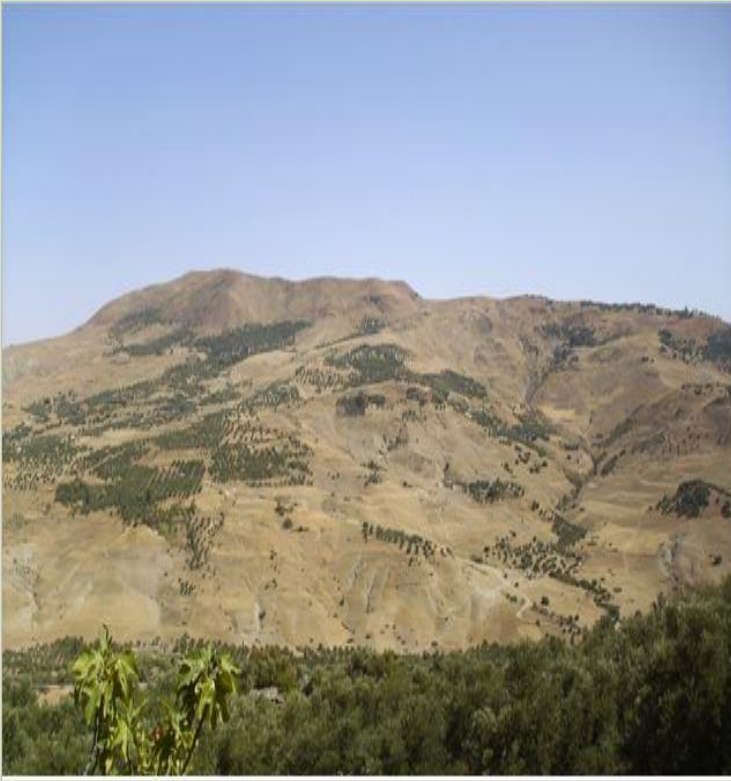
جبل موحا موسى ويمكن ملاحظة كثرة السيوخ وآثار الانهيار بادية على تضاريسه

إن التعرية الكبيرة التي عرفت المنطقة حولتها في معظمها إلى " سيوخ " من " الفريش " ذات تربة فقيرة ومردودية ضعيفة، علاوة على مساهمتها الكبيرة في توحد سد ادريس الأول في الساقلة، على واد إيناون، وتسببت في أزمة مياه مزمنة.